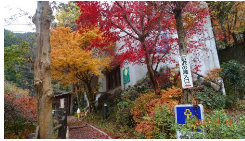
ギャラリー喫茶 (やまびこ)