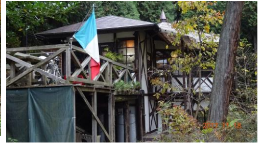
イタリアンレストラン (ヴァッラ デルビー)