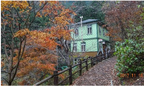
工房 (森のささやき)

そこから十分程奥に進めば「弘沢の滝」。ウッドチップの遊歩道は歩きやすく、バス停から十五分程で滝に着きます。また、以前紹介した「そば処 みちこ」は平成三十年の営業をもって閉店だそうです。まだの方はぜひ一度、絶品お蕎麦と天ぷら、その他数々の料理をお楽しみ下さい。電気が通ってないのですべての料理は薪で加熱しています。蕎麦も料理も釜茹です！