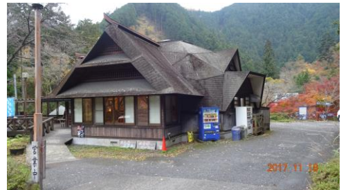
お食事処 (四季の里)