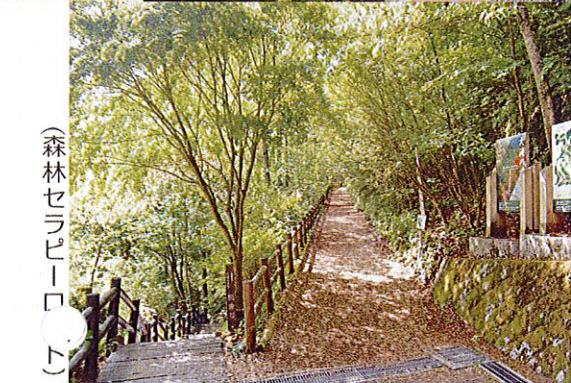
(森林セラピーロード)