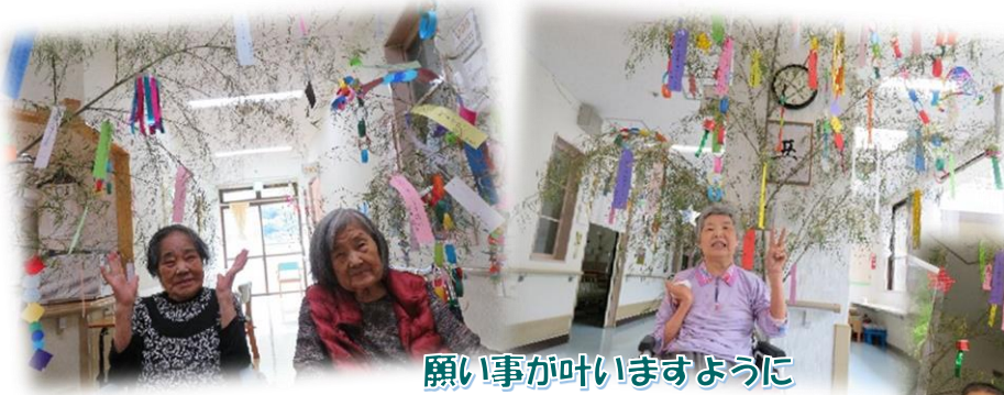
願い事が叶いますように