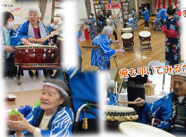
俺も叩いてみるか