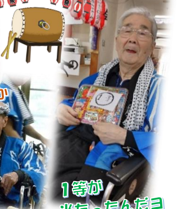
1等が当たったんだヨ