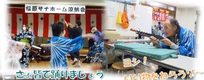
さあ皆で踊りましょう