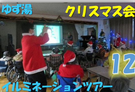
ゆず湯 クリスマス会 イルミネーションツアー