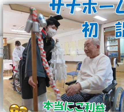
本当にご利益あるのか?