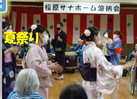
夏祭り 検原サナホーム涼納会