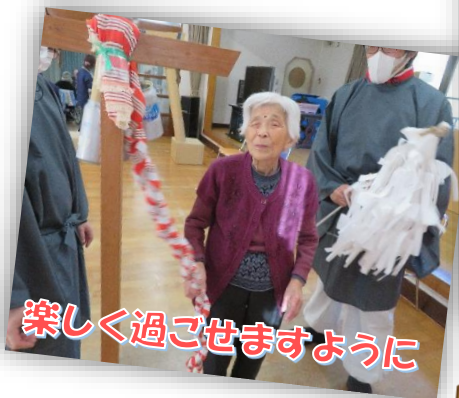
楽しく過ごせますように