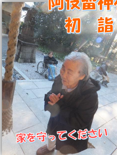
家を守ってください