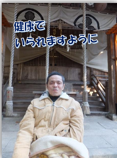
健康でいられますように