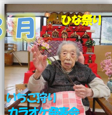
ひな祭り いちご作り カラオケ発表会