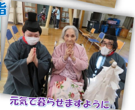
元気で暮らせますように