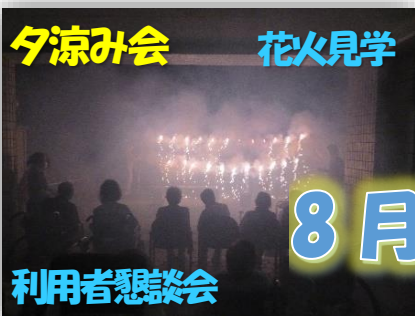
夕涼み会 花火見学 利用者懇談会