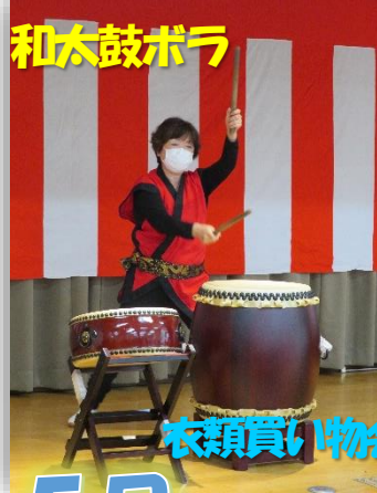
和太鼓ボラ 衣類買い物会