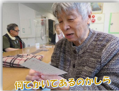
何てかいてあるのかしら