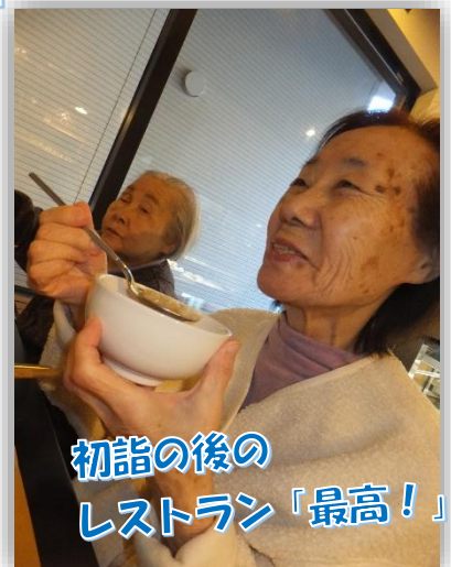
初詣の後のレストラン「最高!」