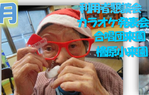
利用者懇談会 カラオケ発表会 合唱団来園 檜原小来園