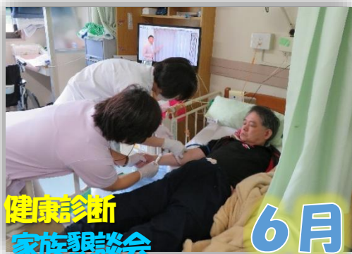
健康診断 家族懇談会 利用者懇談会 映画会