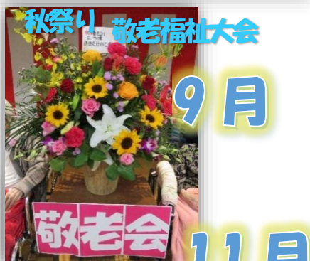
秋祭り 敬老福祉大会 敬老会