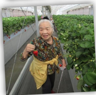
イチゴたくさん採れたよ~