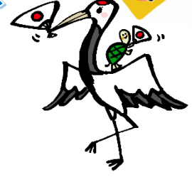
俺の美声 聴かせちゃうよ~♪