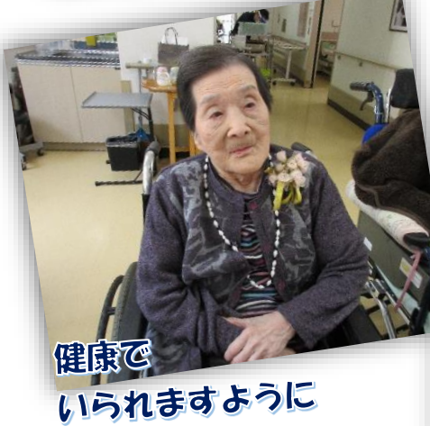
健康で いられますように