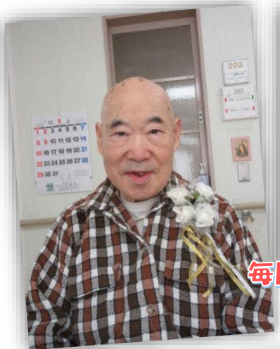
毎日楽しく過ごせますように