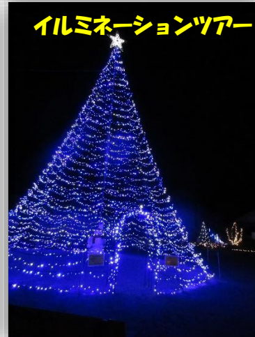
イルミネーションツアー