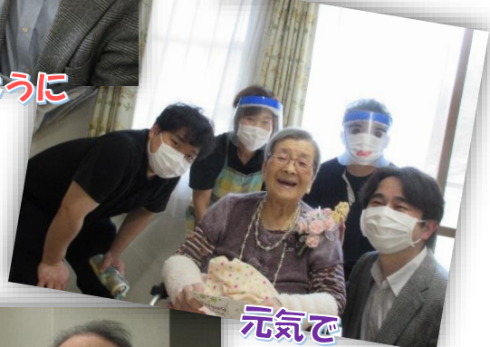
元気で 暮らせますように