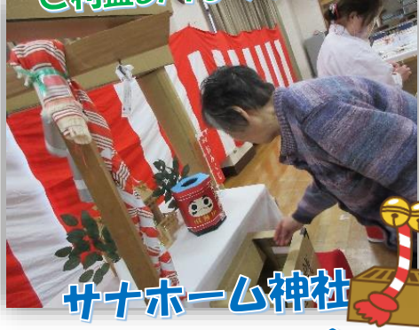
ご利益ありますように