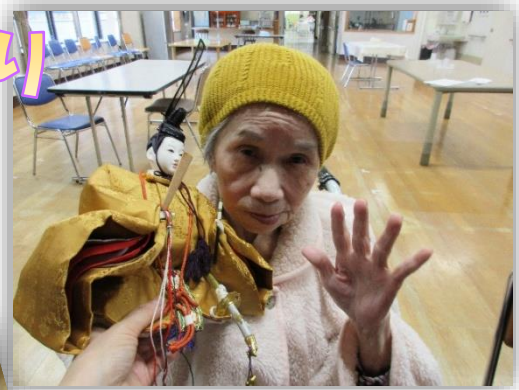
綺麗なお雛さまだこと