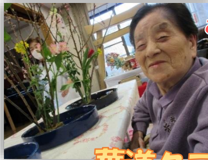
お花綺麗にできました